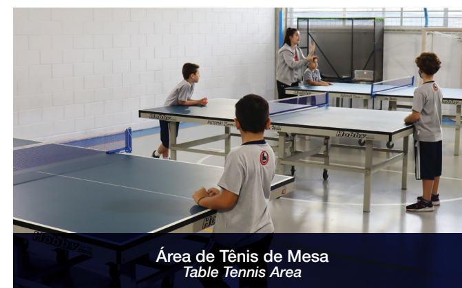
Área de Tênis de Mesa Table Tennis Area