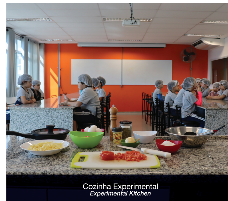
Cozinha Experimental Experimental Kitchen