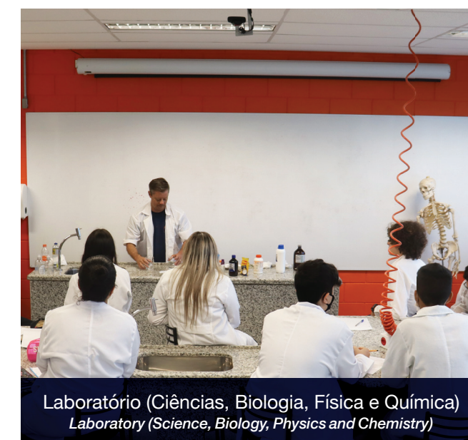
Laboratório (Ciências, Biologia, Física e Química) Laboratory (Science, Biology, Physics and Chemistry)