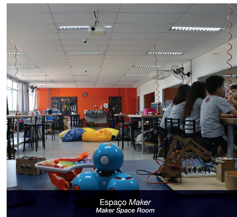
Espaço Maker Maker Space Room