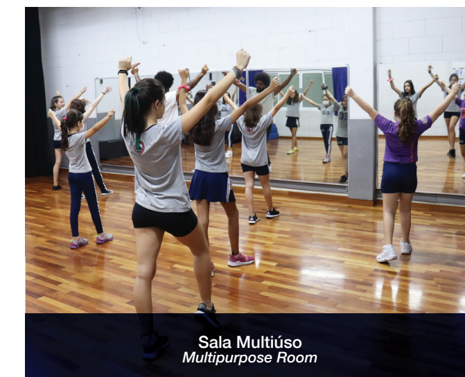
Sala Multiúso Multipurpose Room