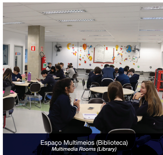
Espaço Multimeios (Biblioteca) Multimedia Rooms (Library)