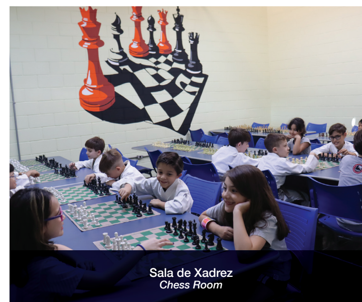
Sala de Xadrez Chess Room