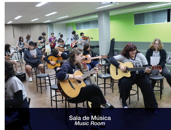
Sala de Música Music Room