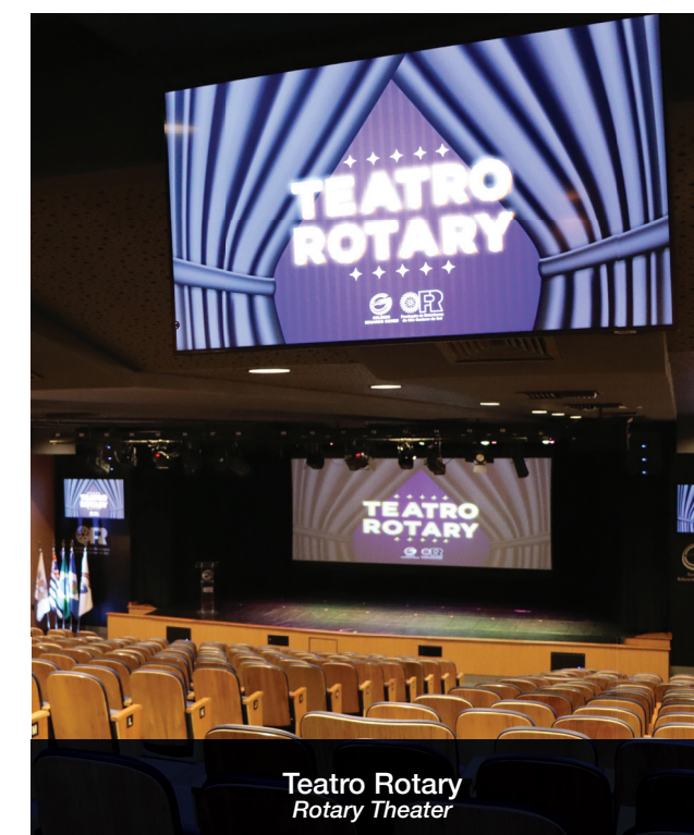
Teatro Rotary Rotary Theater