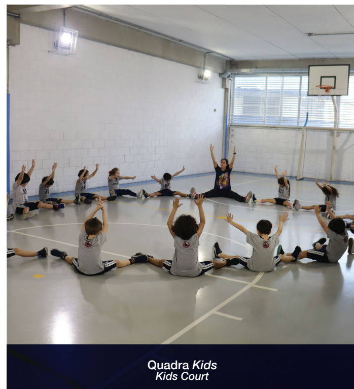
Quadra Kids Kids Court