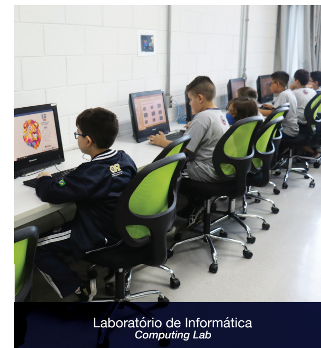
Laboratório de Informática Computing Lab