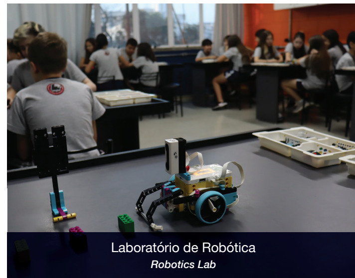
Laboratório de Robótica Robotics Lab