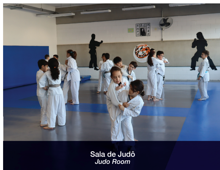
Sala de Judo Judo Room