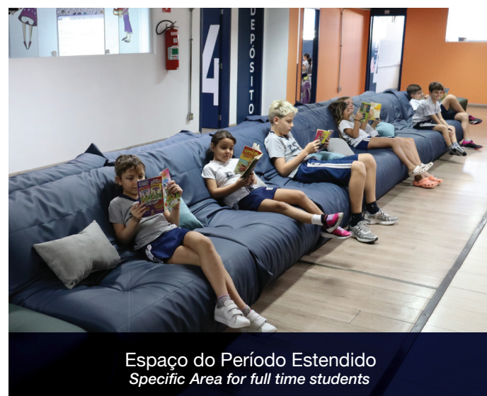
Espaço do Período Estendido Specific Area for full time students