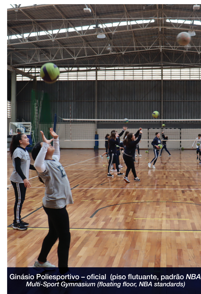
Ginásio Poliesportivo – oficial (piso flutuante, padrão NBA) Multi-Sport Gymnasium (floating floor, NBA standards)