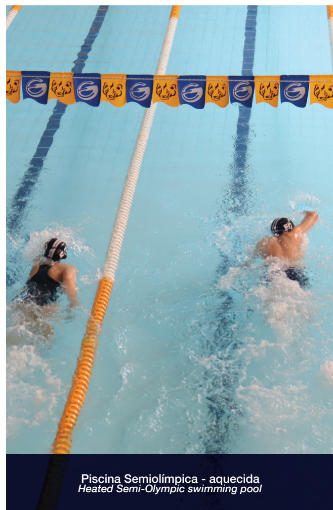
Piscina Semiolímpica - aquecida Heated Semi-Olympic swimming pool