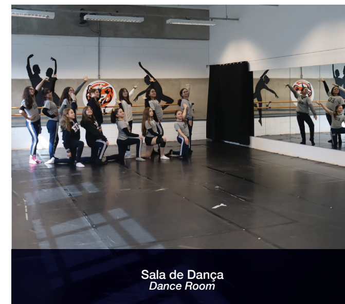
Sala de Dança Dance Room