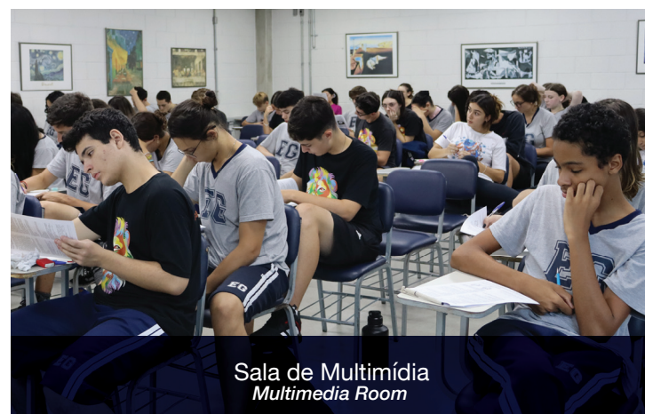
Sala de Multimídia Multimedia Room