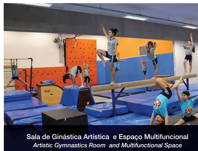
Sala de Ginástica Artística e Espaço Multifuncional Artistic Gymnastics Room and Multifunctional Space