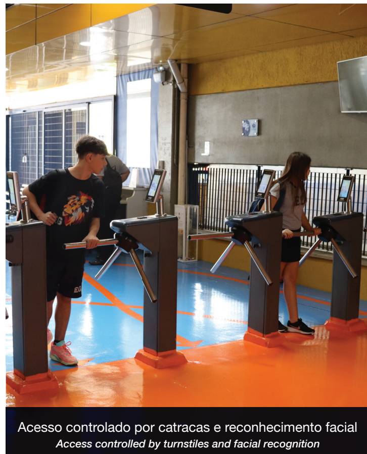
Acesso controlado por catracas e reconhecimento facial Access controlled by turnstiles and facial recognition