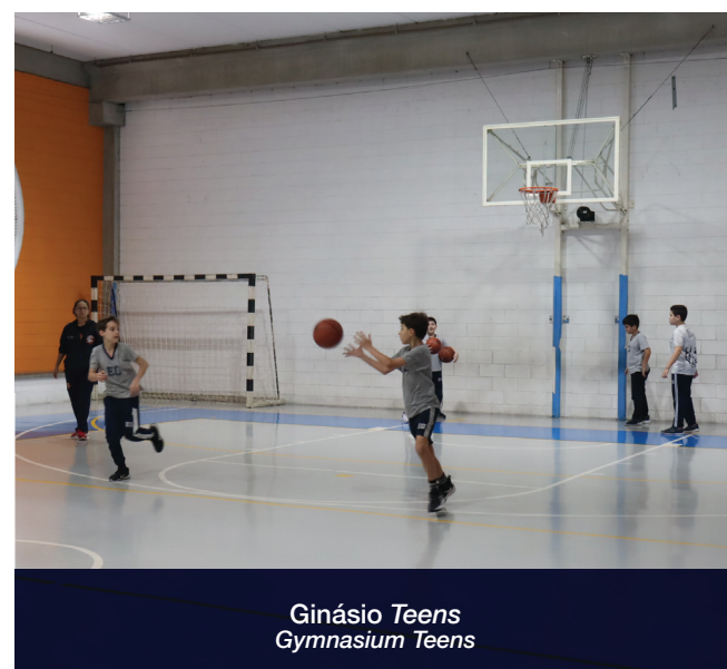
Ginásio Teens Gymnasium Teens