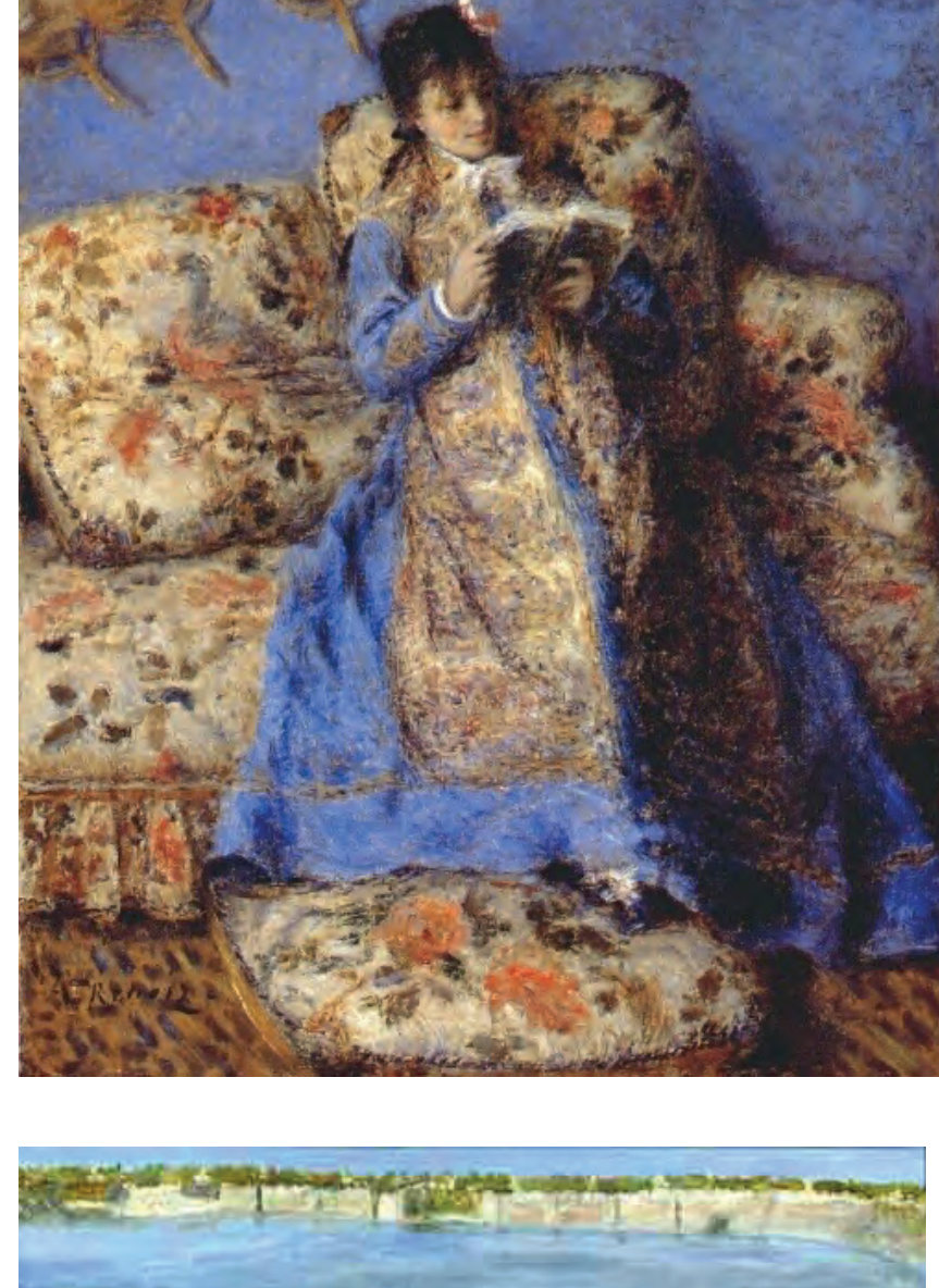
Madame Monet Lendo - Claude Monet Pintor impressionista francês (1840-1926)